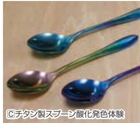
C チタン製スプーン 酸化発色体験