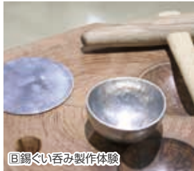
B 錫ぐい呑み 製作体験